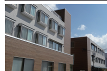
介護付き有料老人ホーム