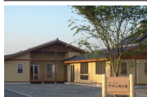
認知症対応型グループホーム